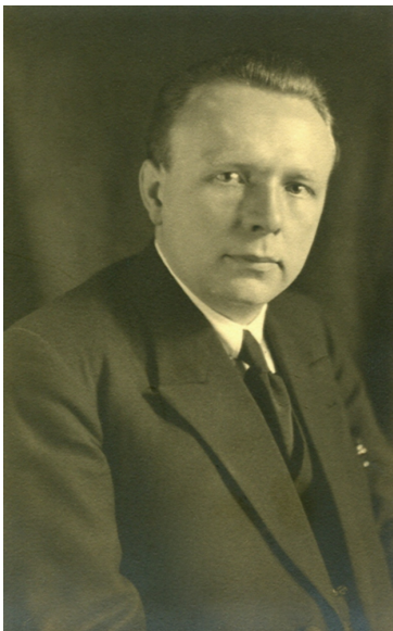
Thomas de Backer in 1940

Het verhaal van de Tweede Wereldoorlog en zijn gevolgen is in België nog steeds een moeilijk verhaal. Er werd en wordt weliswaar de laatste decennia behoorlijk wat gepubliceerd over de thema's 'bezetting, collaboratie en repressie' maar niet steeds even ernstig, zorgvuldig. En helaas ook niet steeds met de nodige afstand en/of nuance. Voor een deel vindt die soms ronduit belabberde kwaliteit een verklaring in het 'herdenkend' karakter van nogal wat publicaties die daardoor al meteen onder tijdsdruk staan. Dat neemt soms de vorm aan van een (eerder meer dan minder) commerciële uitgever ter gelegenheid van 50 jaar dit of 75 jaar dat of een comité ad hoc dat de schijnwerpers zoekt. En zelfs het Centrum voor de Studie van Land en Volk van de Kempen ontsnapte niet helemaal aan die kalenderdwang. Maar precies daardoor kreeg ik de gelegenheid u enkele bevindingen voor te leggen van een onderzoek dat reeds begon in het midden van de jaren '70 van vorige eeuw. Ik maakte immers aan de KU Leuven bij de professoren Lode Wils en Louis Vos mijn licentiaatsverhandeling over 'Thomas de Backer en zijn Katholieke Vlaamse Volkspartij (1925-1932)' en ook nadien nog bleef het thema me boeien en bezighouden. Een aantal onderzoeksresultaten werden in de voorbije decennia reeds gepubliceerd 2 .